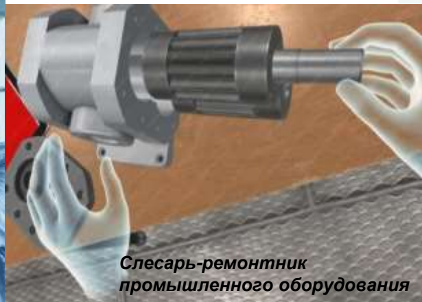
Слесарь-ремонтник промышленного оборудования