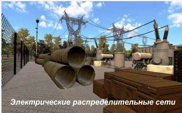
Электрические распределительные сети