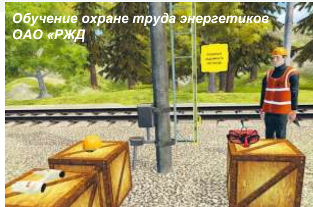
Обучение охране труда энергетиков ОАО «РЖД»